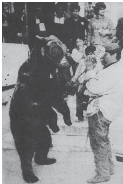
Хайде мечано, покажи на тези момчета как са ги тълчели по време на тоталитаризма разни началства... и как ще ги тълчат пак някой от същите, които се „преустроиша“ на бързо...