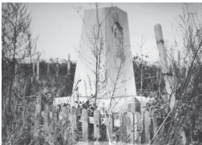
Голо оръжие 1876